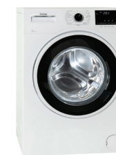
Cylinda FT 5574X