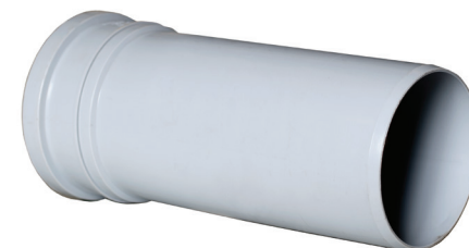
Uponor Uponor S&W